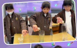
探究水有沒有固定形狀，並向同學分享自己的發現