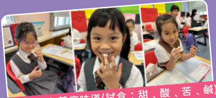
探究食物有甚麼味道(試食：甜、酸、苦、鹹)