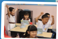
「小一適應日」電子學習