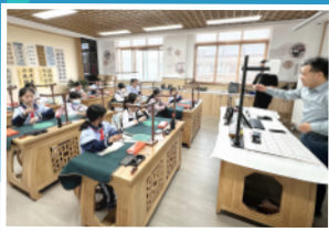
探訪內地姊妹學校。

孩子長大一點,學習世界更廣闊!本年度我們以「中華文化」為主題,帶領學生走進「非物質文化遺產(非遺)」的世界,體驗好玩的傳統手藝。此外,透過與內地「姊妹學校」的交流,孩子能結交新朋友,親身見證國家的快速發展。這絕對比單聽老師講解更大開眼界!