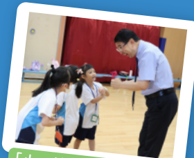
「小一適應日」躬手作揖 認識新朋友