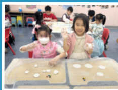
將親手搓的湯圓帶回家,與家人分享。