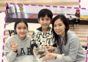
「童來賀新春」親子活動

本校舉辦多元化的家長教育活動，聚焦於小一學童的「自理能力」、「生活常規」與「情緒支援」三大需要。活動讓家長掌握正向管教技巧，引導子女順利適應小學生活。