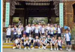
在公園實踐公共守則,學習做個好公民。