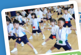
「小一適應日」動動手腳 強健身體