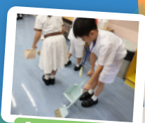
「小一適應日」愛護課室我做到!