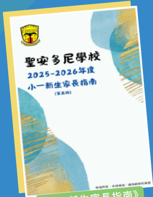
《小一新生家長指南》