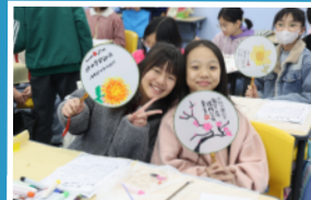
發揮藝術天份,繪畫團扇。