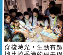
穿梭時光,生動有趣地比較香港的過去與現在。