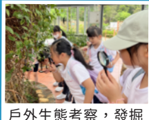
戶外生態考察,發掘身邊可愛的動植物!