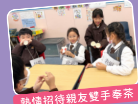
熱情招待親友雙手奉茶