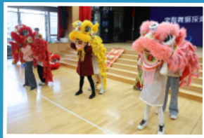
咚咚鏘!齊來體驗活力十足的傳統舞獅。