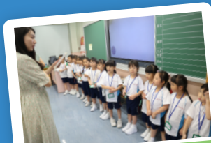
「小一適應日」排排隊 守規矩