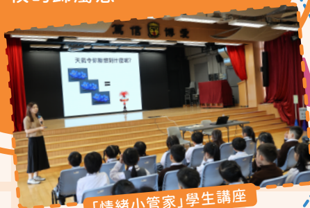
「情緒小管家」學生講座

為支援小一學生適應小學生活，學校社工舉辦特別成長課、小一適應工作坊及訓練小組，讓學生建立課堂常規、情緒管理及社交技巧，加強學生的自我管理能力及對學校的歸屬感。