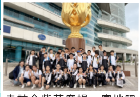
走訪金紫荆廣場,實地認識香港地標!

學習由身邊開始!我們帶孩子走出校園,走訪地標設施、接觸大自然,甚至動手做小手工。透過「親眼看、親手做」,將書本知識轉化為真實體驗,從小激發他們對身邊事物的好奇心。