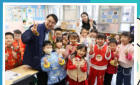
走進「非遺」世界,動手捏出精緻可愛的麵塑!