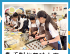
動手製作美味曲奇,體驗創作樂趣。