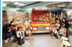
「長大後我想做...」體驗不同職業,了解社會各行各業。