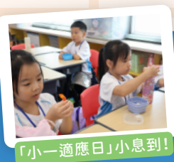
「小一適應日」小息到!

本校在正式開學前，會為準小一生家長安排家長會，並派發《小一新生家長指南》，教導家長如何在家中協助子女過渡至小一。而在開學前一週，更會安排小一適應週，讓小一生提早認識學校、老師及同學，建立常規，盡快投入小學生活。本校更有註校社工為家長及學生舉辦工作坊、講座及親子活動等。教育心理學家亦會定期到校，為有學習需要的學生提供服務。