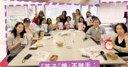
「孩子『機』不離手：家長實戰指南」家長工作坊