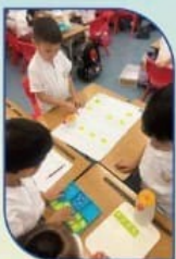
跨學科活動(數學及電腦)-討論機械人的行走路線