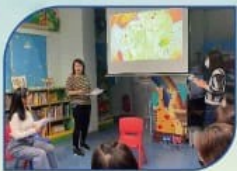
家長教育-閱讀日家長工作坊