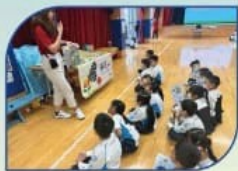
教育講座-保護天然資源