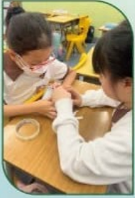
常識課中選取適當的隔熱物料