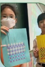
視覺藝術堂上編織小屋裝飾