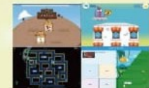
We love playing online games!