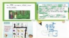
We love doing all sorts of activities!

During the COVID-19 pandemic, students lacked the opportunity to interact in English and to play with others. In recognition of that, to enhance students' speaking and generic skills, our school has developed modules named 'CLAP' which stands for Classroom Language Activity Pack. Part of the pack are consolidation activities which are card and board games that are strategic or communicative in nature, carried out in groups. They are played after each module is taught. The feedback since implementation has been positive, and students are highly motivated.