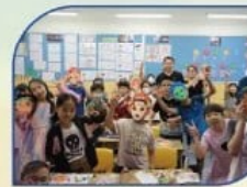
閱讀日-聽聽故事動動手