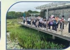
走出課室-荒地探索