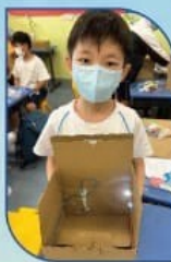
動手操作-製作智能禮物盒