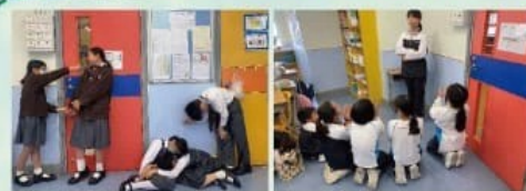
前置教學-靜止觀察