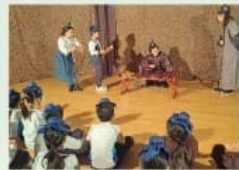
藝團造訪-進入角色討論及匯報