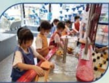
參觀兒童探索博物館