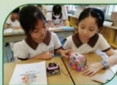
同學製作可測量溫度的micro:bit