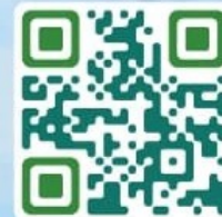
聖安多尼學校校網

本校將於9月舉辦小一入學簡介會，家長可到本校網站，進入Google Form連結報名。名額有限，先到先得！