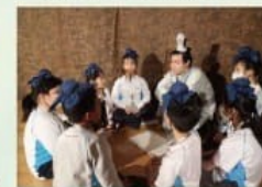
藝團造訪-進入角色討論

為提高學生對中國經典名著的學習興趣，豐富學生中國文學及文化的涵養，並培養學生正面的價值觀及創意思維，本校參與了由香港賽馬會慈善信託基金捐助，愛麗絲劇場實驗室策劃及推行的「中國經典名著教育劇場計劃」。透過一系列戲劇活動，學生能親身投入不同的經典著作場景中，生動有趣地認識經典著作的內涵，同時激發學生的創意思維。而在活動中表現突出的學生亦能獲得「創意覺醒獎章」，鼓勵他們繼續在文學範疇探索。