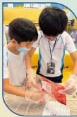
小實驗-士多啤梨有沒有DNA呢