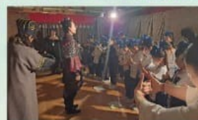
藝團造訪-進入角色