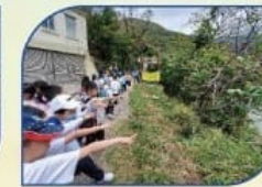
走出課室-遊覽薄扶林郊野公園