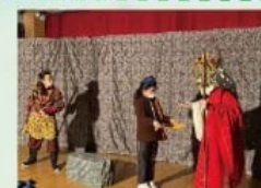
藝團造訪-進入角色解決問題