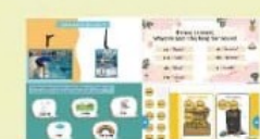
We love to challenge ourselves!